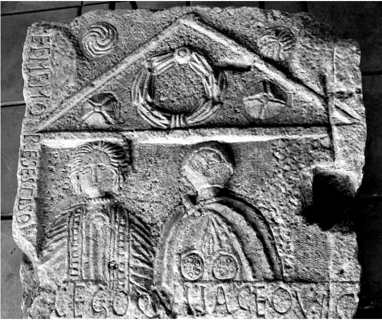
Fig. 4. Razgrad (Bulgaria), Abritus Museum – istoricheski muzey Abritus. Particolare della stele iscritta con l'inizio del verso 73 di Ovidio, Tristia , III, 3.

Anche in questo caso, come nei due precedenti, l'iscrizione si apre con le parole [Hi]c ego qui iaceo , che riprendono testualmente l' incipit dell'epitaffio di Ovidio. E non solo: a questo attacco viene conferito un risalto del tutto particolare, dato che è stato inciso, con lettere di dimensioni molto maggiori rispetto a quelle delle altre righe (e come non pensare alle « grandibus in tituli marmore [...] notis » del v. 72 del carme di Ovidio?), nella fascia a rilievo che separa il registro con i ritratti dal sottostante specchio epigrafico (Fig. 4).