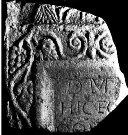
Fig. 1. Costanza (Romania), Muzeul de Istorie Națională și Arheologie. Il frammento di stele con l'attacco del verso 73 di Ovidio, Tristia , III, 3 (da Aricescu 1963, fig. 3).

timi anni della sua vita, si rinvenne casualmente l'ampio frammento di una stele sepolcrale in calcare locale ( Fig. 1 ), 2 con specchio epigrafico delimitato da una cornice a gola e listello e contornato all'esterno da tralci di vite, con pampini e grappoli alternati nelle anse dei girali. 3